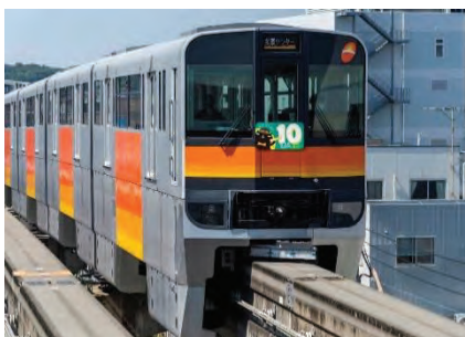
ヘッドマーク付き列車のイメージ